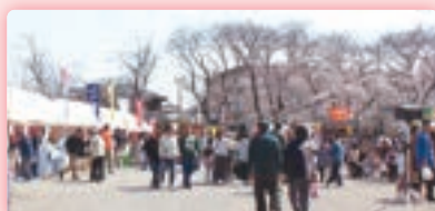
鴻巣会場 (鴻巣公園)

約500本の桜が元荒川親水護岸の両側に咲き誇る市内有数の名所です。桜の花が水面に映り、人気の撮影スポットにもなっています。イベント当日は模擬店の出店やステージイベントも開催を予定しております。