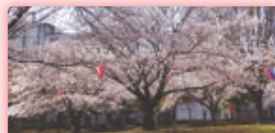
川里会場 (あかぎ公園)

約200本の桜が鴻巣公園を囲み、直売市やキッチンカーが出店。また各種団体によるパフォーマンスが披露されます。ご家族でお楽しみいただけます。