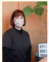
Spica body therapy (スピカボディセラピー) 鴻巣市宮前 令和4年3月開業 9月加入

開業を考えていたところ、知り合いから商工会を紹介されました。税務署への手続きなどの初歩的なことから丁寧に教えていただきました。その時に、「事業主は廃業しても退職金のようなものはないので、将来的なことを考えてみたら?」と【小規模企業共済】への加入を勧めていただきました。少額の掛金で加入でき、確定申告の時には所得控除を受けられ、給付を受けるときは退職所得控除が適用される等の説明を受け加入を決めました!申込書を記入するだけで、その後の手続きについては商工会にお任せできたので安心でした。